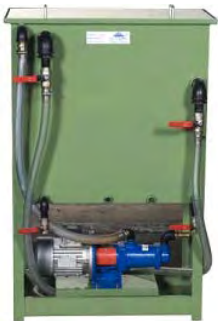
Scomparto primario (separazione per gravità)